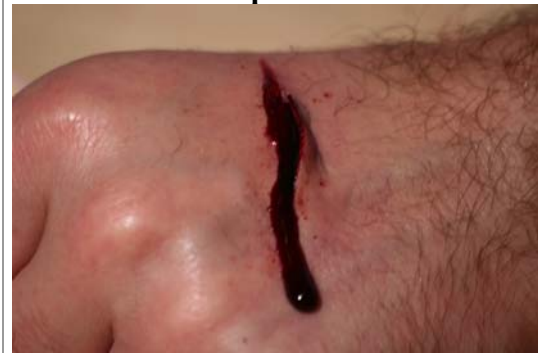
Etape N° 5

Appliquer du Sang artificiel dans le cratère. Placer un corps étranger