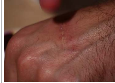
Etape N° 6

Finir la coloration par du Fard rouge-sang .