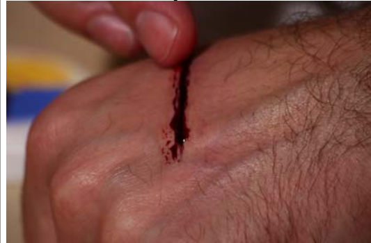
Etape N° 8

Badigeonner l'ensemble de la réalisation avec du Sang artificiel . Estomper le surplus de Sang artificiel avec un kleenex