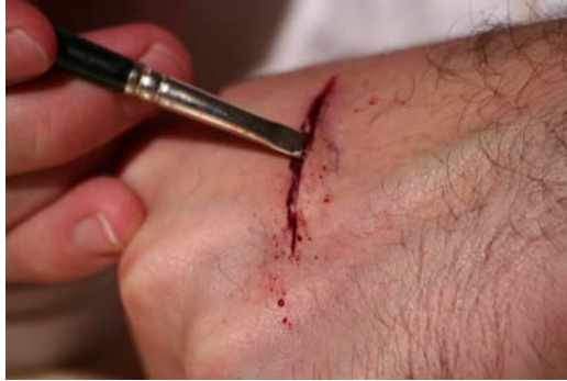
Etape N° 2

Placer le Pinceau N°2 imbibé de Fard rouge-sang dans « l'amorce » et faire de petits mouvements pour soulever la lèvre de Plasto-Nat .