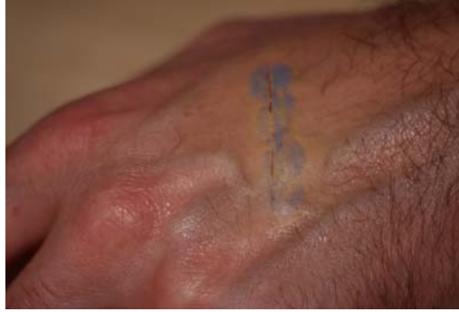
Etape N° 5

Commencer la coloration externe par du Fard jaune . Tapoter de façon nuancée.