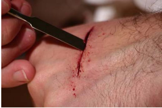
Etape N° 1

Faire glisser doucement la spatule verticalement dans l'incision puis placer la spatule à 45° et faire de petits mouvements oscillants afin de faire une amorce pour soulever la lèvre de Plasto-Nat .