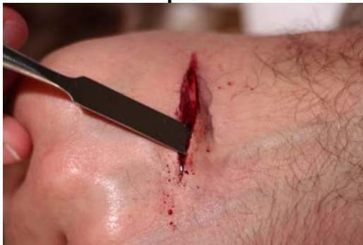
Etape N° 4

Prendre avec la spatule du Sang gélifié et poser une fine pellicule dans le cratère