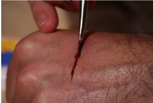
Etape N° 7

Refaire l'incision. Colorer l'intérieur de l'incision avec le Pinceau N°2 imbibé de Fard rouge-sang .