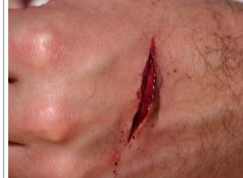
Etape N° 3

Placer le Pinceau N°2 imbibé de Fard rouge-sang dans « l'amorce » et faire de petits mouvements pour soulever la lèvre de Plasto-Nat .