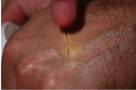
Etape N° 4

Commencer la coloration externe par du Fard jaune . Tapoter de façon nuancée.