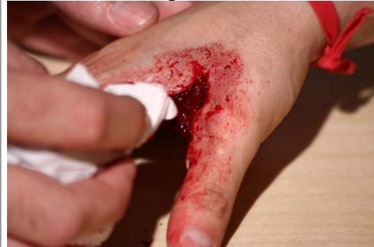
Etape N° 11

Estomper le Sang artificiel avec un kleenex afin de donner un effet plus « nuancée ».