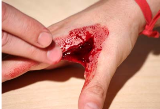
Etape N° 10

Badigeonner l'ensemble de la réalisation avec du Sang artificiel « normal »