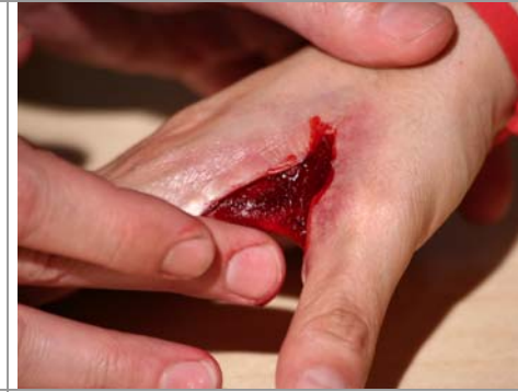
Etape N° 9

Remplir le cratère de Sang gélifié . Répartir au doigt le Sang gélifié en fine couche.