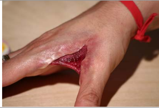
Etape N° 8

Superposer du Fard bleu et finir avec le Fard rouge-sang . Travailler de façon nuancé.