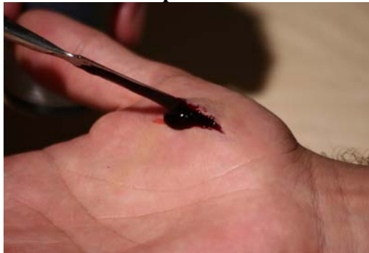
Etape N° 10

Poser du Sang artificiel dans le cratère.