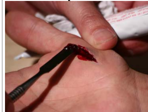
Etape N° 9

Remplir l'incision avec du Sang gélifié .