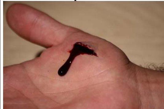
Etape N° 11

Faire couler une goutte de Sang artificiel .