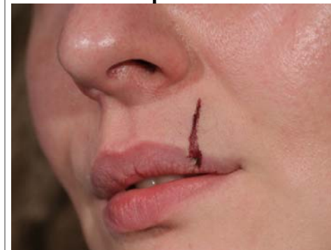
Etape N° 3

Commencer la coloration externe avec du Fard bleu et superposer du Fard rouge-sang . Remplir le cratère avec le pinceau N°2 imbibé de Fard rouge-sang