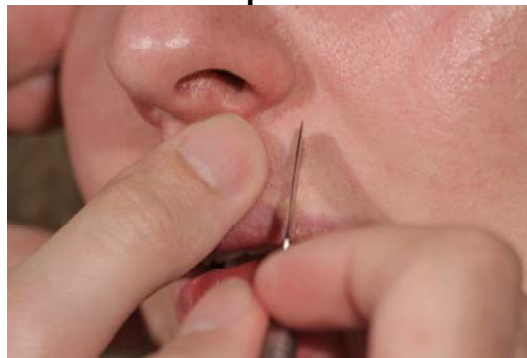
Etape N° 2

Faire une incision au centre de la réalisation, tremper la spatule inox dans de la Gelée démaquillante .