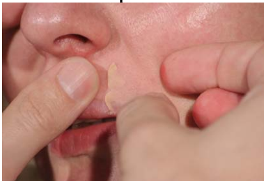
Etape N° 1

Appliquer un mince cylindre de Plasto-Nat sur la lèvre supérieure. Lisser les bords du Plasto-Nat vers l'extérieur